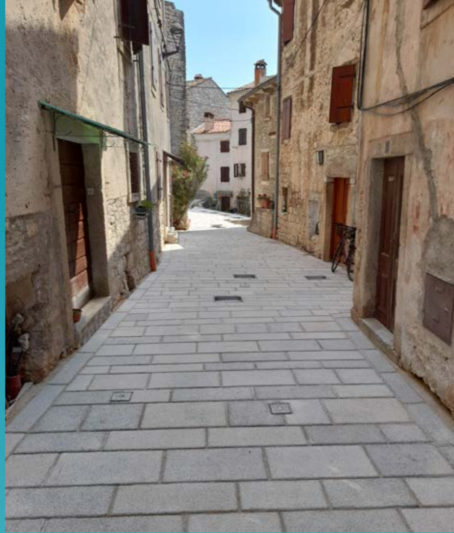
Corto Bechera - dovršeni radovi