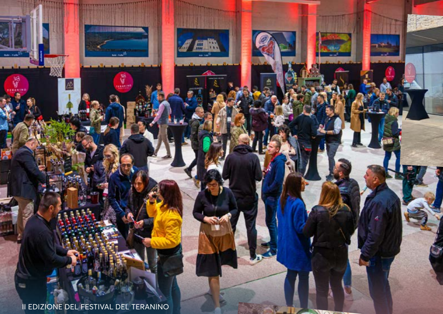
II EDIZIONE DEL FESTIVAL DEL TERANINO