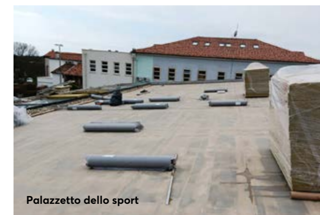
Palazzetto dello sport