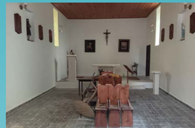
Chiesa a Krmed