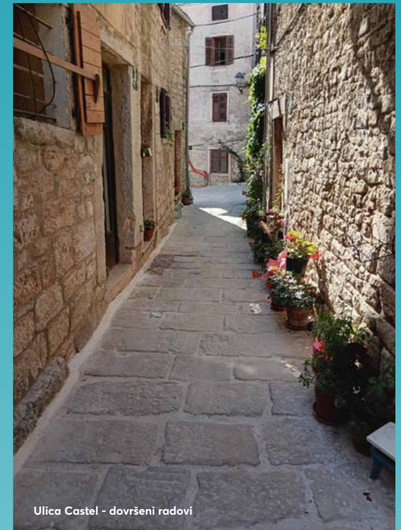
Ulica Castel - dovršeni radovi