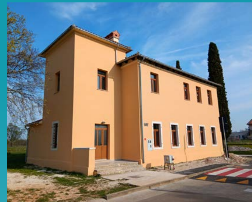
Obnovljena školska zgrada u Krmedu