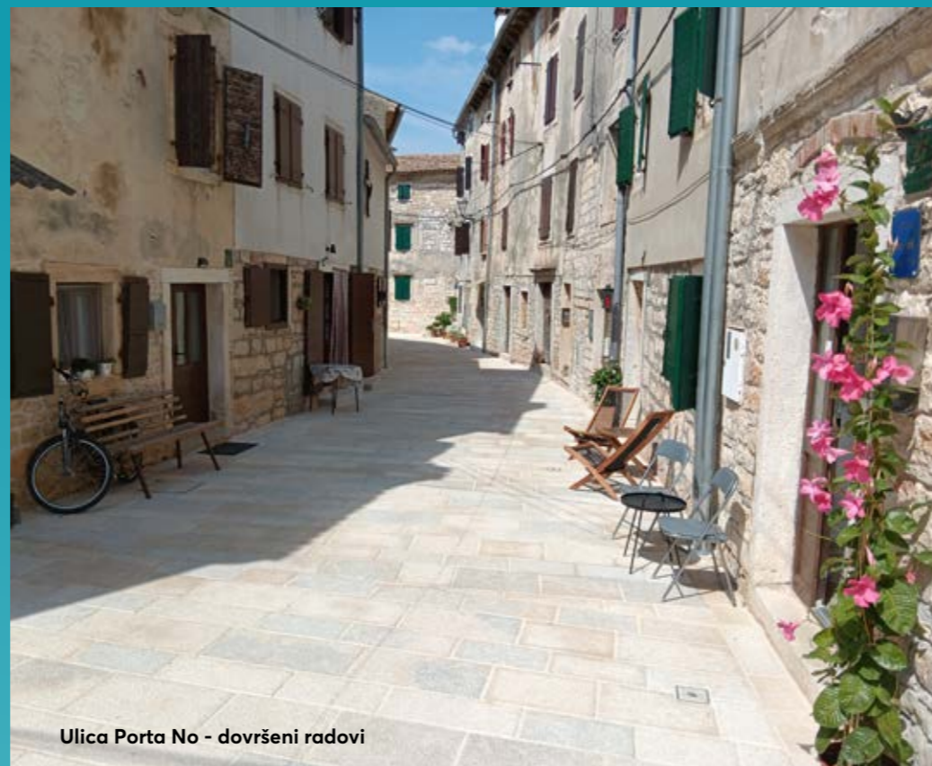
Ulica Porta No - dovršeni radovi