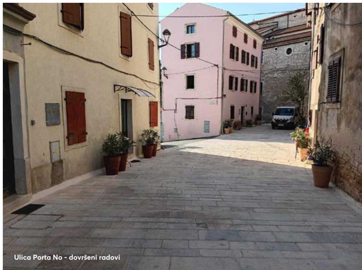
Ulica Porta No - dovršeni radovi

U ovoj godini ulaganja u komunalnu infrastrukturu iznose nešto više od 1,8 milijuna eura