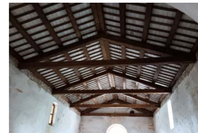
Sanacija krova crkve Sv. Antuna