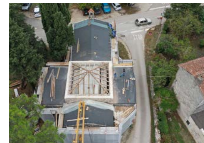
Chiesa di S. Antonio