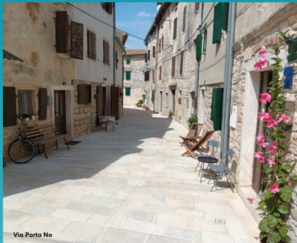
Via Porta No