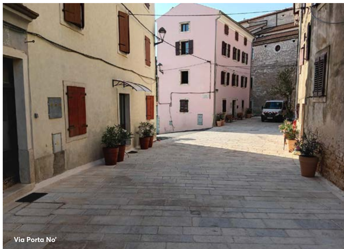
Via Porta No'

Quest'anno quelli nell'infrastruttura comunale ammontano a poco più di 1,8 milioni di euro