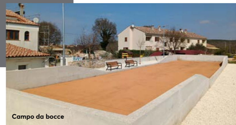
Campo da bocce

È stata creata anche la nuova futura strada tra via Fonde e via Umago, della lunghezza di circa 400 metri. Per la sua apertura e il relativo riempimento sono stati spesi 45.000 euro.