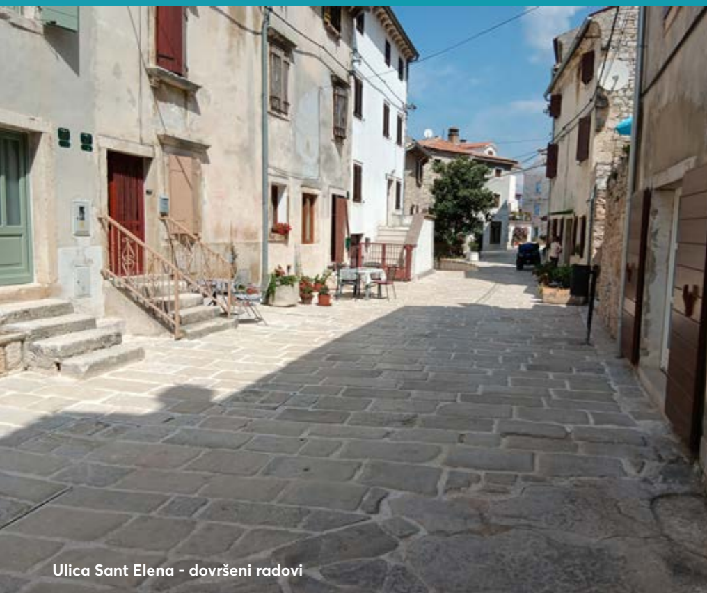
Ulica Sant Elena - dovršeni radovi