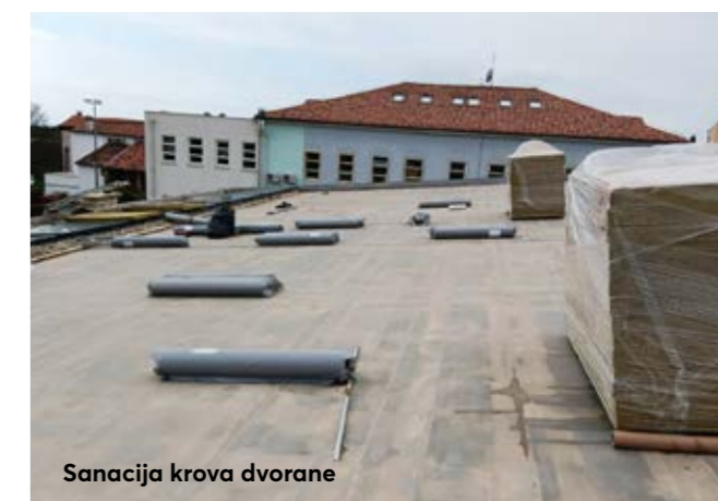
Sanacija krova dvorane